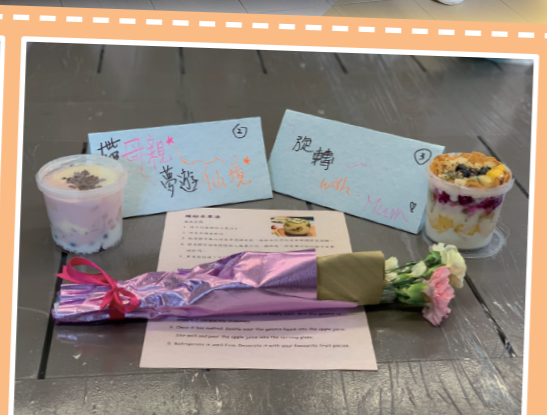
勝出的甜品賣相及名字精美