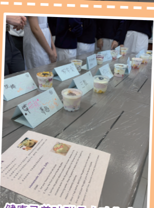
健康又美味甜品大功告成