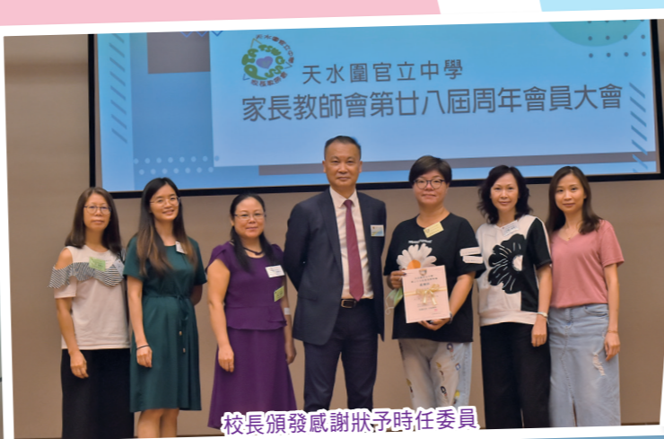
校長頒發感謝狀予新任委員