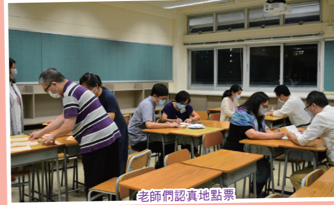
老師們認真地點票