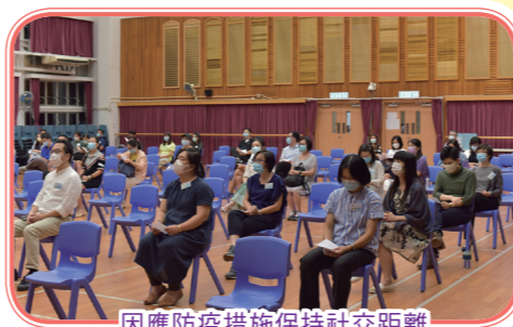
因應防疫措施保持社交距離