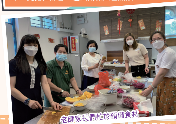
老師家長們忙於預備食材

家長教師會今年參與跨科組活動，舉辦「繽紛水果凍」以慶祝母親節。學生們精心設計健康又美味的水果凍食譜，並親自製作及裝飾水果凍，以競逐「最高心果凍」及「最佳賣相」兩個獎項。當天三位家長委員不但幫忙預備多款水果，更擔任評審，選出兩款出色甜品。