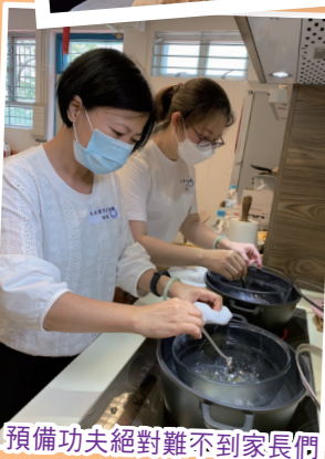
預備功夫絕對難不到家長們