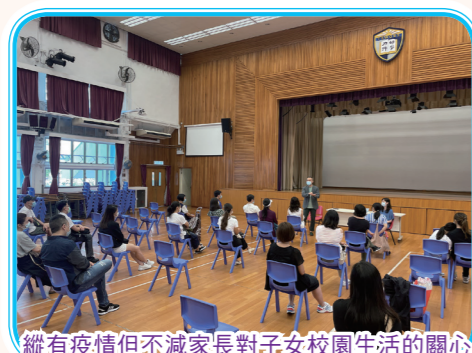
縱有疫情但不減家長對子女校園生活的關心