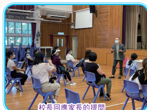
校長回應家長的提問