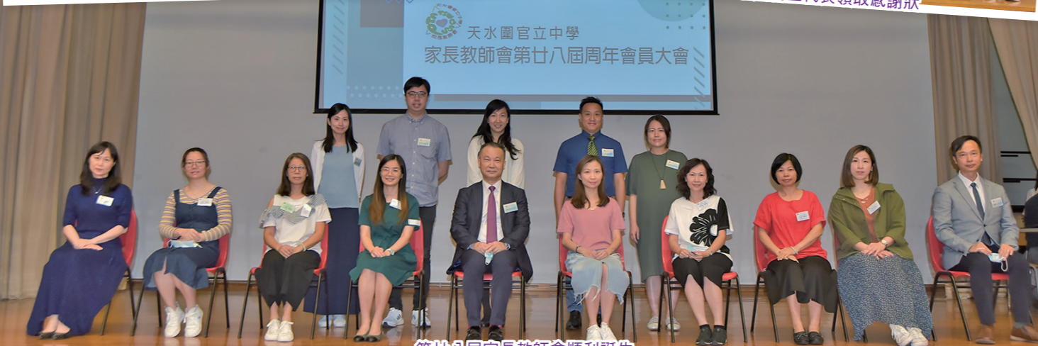
第廿八屆家長教師會順利誕生