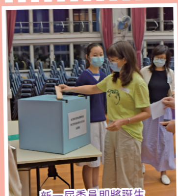
新一屆委員即將誕生