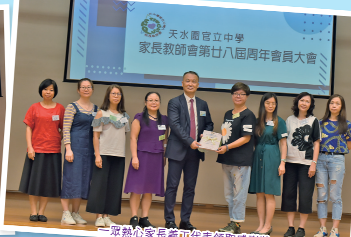
一眾熱心家長義工代表領取感謝狀