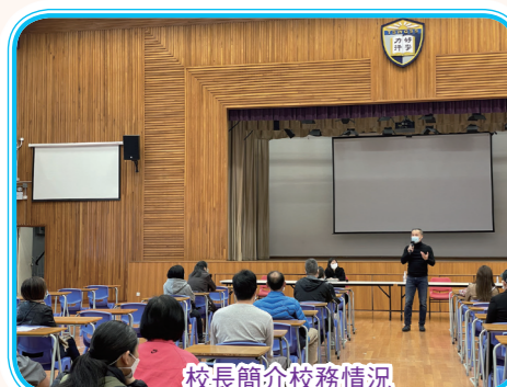
校長簡介校務情況

本校一向重視家校關係，本學年家教會為家長分別於上下學期，共安排了兩次與校長真情對話活動。邀請全校家長與郭校長直接對話交流，加強學校與家長之間的溝通與合作，讓家長更瞭解學校校務發展，以及學生在學校的生活情況。