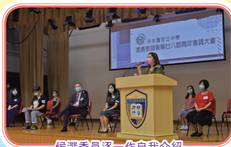
候選委員逐一作自我介紹